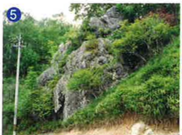
5 衝撃変成したチャートの巨岩 チャートの中にある石英脈に衝撃変成した証拠が入っています。 Mega block of chert metamorphosed by impact