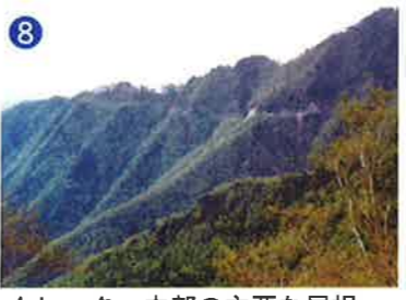
8 クレーター内部の主要な尾根 中央の尾根の下方には、強く衝撃を受けた角礫岩層が少し残っています。(重要な尾根であるが地下にあるため観察不可能) The main ridge remaining on the crater floor