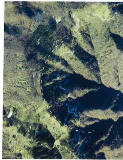
御池山隕石クレーターの円形構造を示す空中写真 Circular structure of the Oikeyama impact crater shown by Aerial Photo