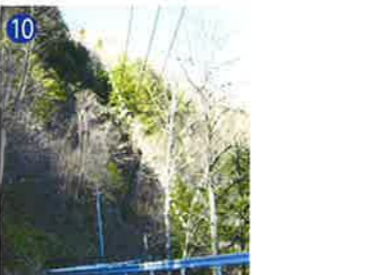
10 クレーター地形の南境界 クレーター内部の岩石はすべて多少とも衝撃を受けています。 Southern rim of the crater