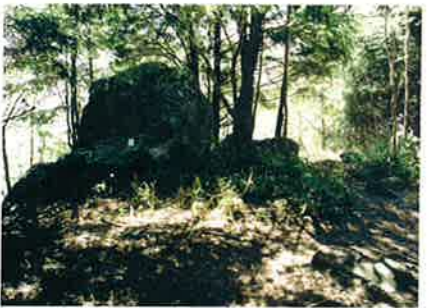
B クレーターの縁の北端 ここから南へクレーター縁に沿った遊歩道になっています。外斜面には衝撃で吹き飛ばされた岩石が転がっています。 Northern outskirts of the crater rim