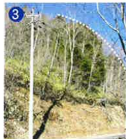
3 クレーター地形の北境界 クレーター縁と道路との交差点。クレーターの外側に比べて中側の地層は急傾斜になっています。 Northern rim of the crater