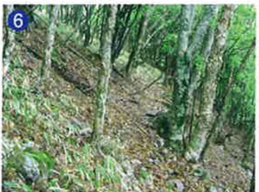
6 崩壊したクレーター内部 一般的には平坦な内部ですが、御池山では崩壊して急斜面です。 The interior of crater, collapsed by erosion