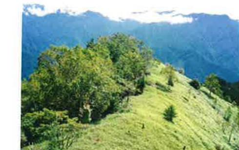
D 御池山頂上 山頂から南方へクレーターが丸く曲がっている地形が見えます。 The summit of Oikeyama