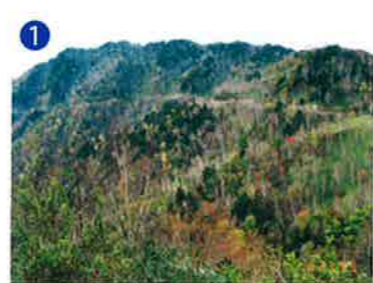
1 道路上のビューポイント 道路沿いでクレーター全体が一番よく見渡せる場所です。 Best view point along the road