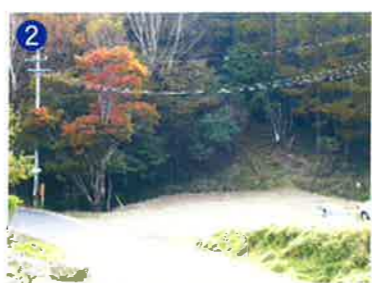
2 遊歩道入り口・駐車場 丘の上展望台へ徒歩約10分御池山頂上へ徒歩約40分(両方向とも遊歩道経由) Parking area and entrance to the path