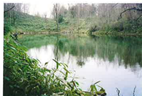
E お池 御池山の名前の由来になった池でここまで遊歩道がついています。 Oike Pond