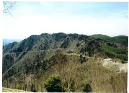
A 丘の上展望台 標高1877mの丘が、地上で最もよく見える展望台です。 This hill is the best observation point.