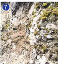
7 高角度に立った地層 クレーター内部の地層は衝撃を受けて高角度に立っています。 The bed is inclined at a steep angle.