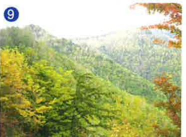
9 クレーター内部の眺望 クレーター内部を比較的広く眺めることができます。 Wide view of the crater