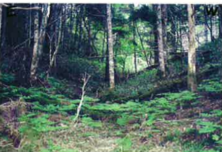
C 外斜面の凸凹地形 クレーターの外斜面には、衝撃を受けて大地を凸凹に変形させた地形が見られます。Bumpy landform on the outer slopes of the crater