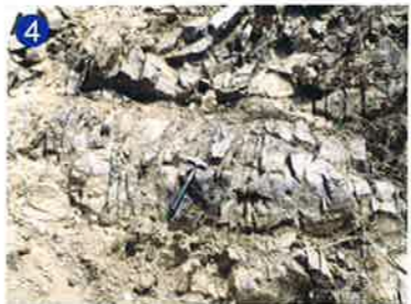
4 衝撃で割れ目が入った地層 クレーターの中心に向かう放射状の割れ目が多数できています。 Rock bed with fractures yielded by impact