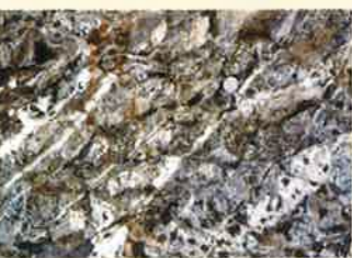
衝撃を受けたチャート (白い石英脈内が変形している スケールは丸い百円硬貨) Shocked quartz vein in chert

One important piece of evidence of the impact is Planar Deformation Features (PDFs) produced in quartz grain. Such PDFs are the most commonly reported structures in about 180 impact sites around the world.